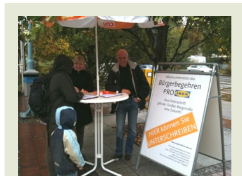
Bei strömendem Regen sammelte die Osdorfer CDU am 10. Oktober vor dem Elbe-Einkaufszentrum Unterschriften, um das Bürgerbegehren zur Ansiedlung von IKEA in Altona zu unterstützen.

Bürgerbegehren betreffen Angelegenheiten die eine Bezirksversammlung entscheiden kann, Volksbegehren erstrecken sich hingegen auf ganz Hamburg. Ein Bürgerbegehren muss mit „Ja“ oder „Nein“ zu beantworten sein und von drei „Vertrauensleuten“ eingereicht werden. Sobald 1% der Wahlberechtigten – in Altona rund 1.800 Personen – ein Bürgerbegehren unterzeichnet haben, dürfen Bezirksamt und Bezirksversammlung drei Monate keinen gegenteiligen Beschluss fassen. Wenn dann insgesamt 3% (=5.400 Personen) unterschrieben haben und die Bezirksversammlung die Forderungen nicht übernimmt, kommt es zu einem Bürgerentscheid, bei dem alle Wahlberechtigten eines Bezirkes abstimmen dürfen. Er hat die gleiche Wirkung wie ein Beschluss der Bezirksversammlung.