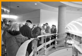
Besichtigung der Baustelle des Elbe-Einkaufszentrums