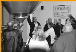
Besichtigung der Holsten- Brauerei