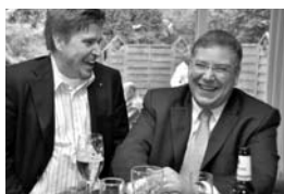
Innensenator Ahlhaus (r.) bei einer Veranstaltung im Ortsverband