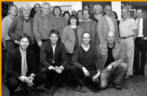
Der neugewählte Ortsvorstand