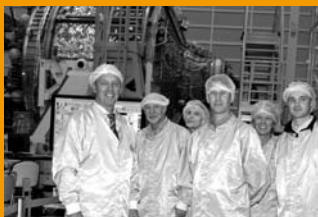
Besichtigung EADS Astrium in Bremen